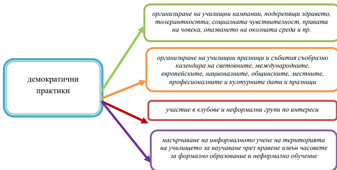
Фиг. 2. Демократични практики за включване на учениците в инициативи [14]

Институционалните политики за подкрепа на гражданското, здравното, екологичното и интеркултурното образование включват и подкрепа на инициативността и участието на децата и учениците чрез подходящи за възрастта им включващи демократични практики (фиг. 2), като: