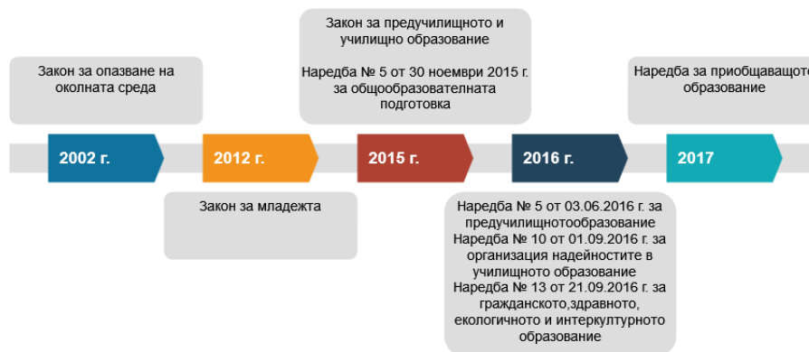
Фиг. 1. Развитие на законодателството – обект на изследване

Изследваното законодателство е представено в хронологичен ред. Неговото развитие е графично отразено чрез фиг. 1: