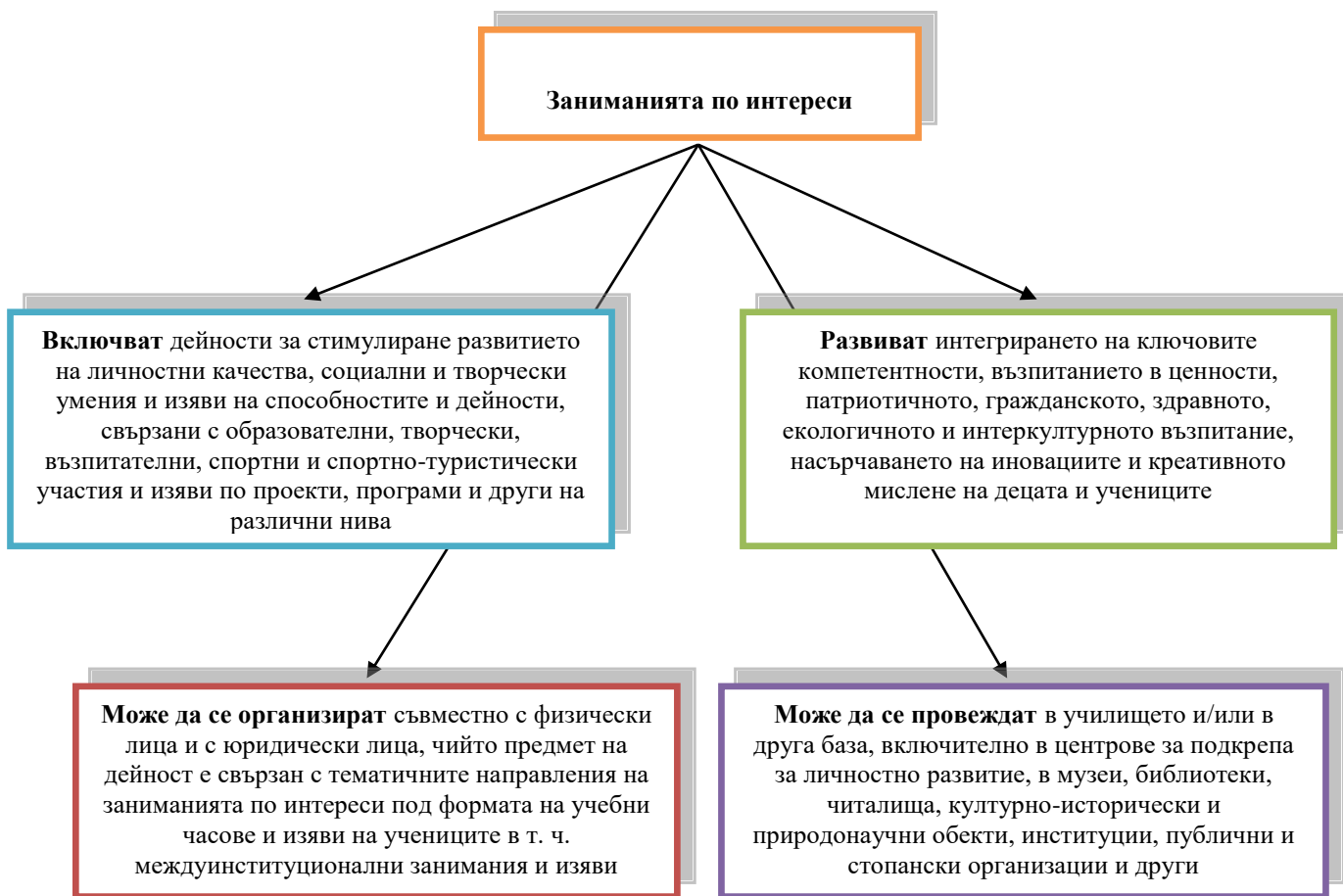
Фиг. 3. Характеристика на заниманията по интереси [15]

Тук е мястото да бъде споменат Националния календар за изяви по интереси на децата и учениците и за провеждане на изяви , одобряван ежегодно от МОН, чрез който се осигурява целогодишна организация за занимания и изяви по интереси на децата и учениците. Той предоставя равен достъп за пълноценно участие в изявите по интереси, подпомага процеса по усвояване на знания, социални и професионални умения, осигурява условия за откриване, стимулиране и развитие на способностите на деца с изяви дарби, повишаване на социалните умения на децата и учениците, формиране на нагласа за учене през целия живот. Към организаторите на изяви са включени различни заинтересовани страни. В направление „Науки и технологии“ на календара са включени четири международни екологични дати [16].