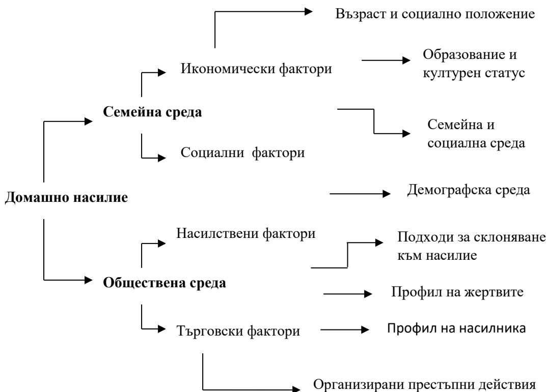
Фиг. 1. Класификация на факторите, методите и средствата за превенция на проституцията

Предложената класификация на Фиг.1 е от съществено значение за предварителната подготовка за превенция, в чиято среда може да си осигури така необходимия ресурс и да се дефинират правата и стабилността на партньорски организации, които да подпомогнат ефективно структури на Министерството на вътрешните работи (полиция, специализирани екипи), психолози и др. [1].