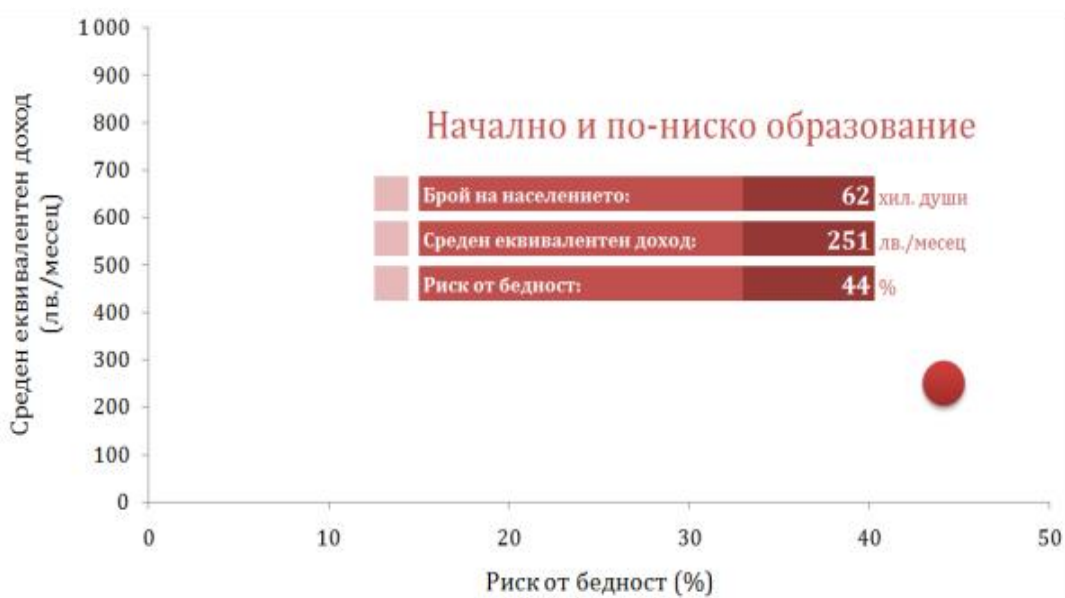
Фиг. 3. Образование и доход – лица на възраст 18 – 29 г.

Образованието оказва съществено влияние върху риска от бедност при работещите. Най-висок е дялт на работещите бедни с начално и без образование - 68.8%. С нарастване на образователното равнище относителният дял на бедните сред работещите намалява приблизително 2 пъти за хората с основно образование и над 4 пъти за тези със средно, пише в доклада на Националния статистическия институт (НСИ).