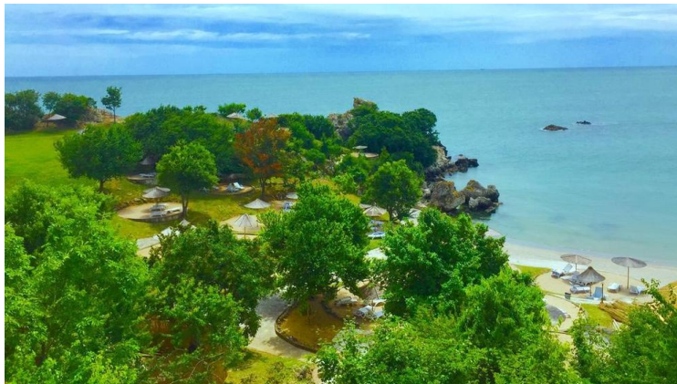
Фиг.8 Курорт Русалка

тридесет болести. Черноморското крайбрежие е разчленено, има заливи и обширни плажове. За Черноморието зная, че другите държави нямат като българските плажове. Ако вземем например Италия и Гърция- имат морски курорти, но температурите са много по-високи. Говоря единствено от позицията на атмосферни условия. На север- скандинавци и германци са свикнали с техните курорти и като стане температурата на водата 16-18°се къпят. Условия за развитие на туризма в България има.