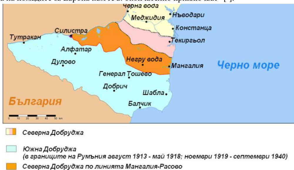
Фиг.6 Карта на цяла Добруджа

По земите край Дуранкулак, Крапец и Шабла са се зародили древни цивилизации много преди да се развият културите в Месопотамия (Шумери, Ниневия, Вавилон) и по река Инд (Мохенджо-Даро и Харапа). Имам предвид Хаманджийска, Блаватска култури, Варненска, Провадийска цивилизации. Причина за разселването не е само бягането от атаките на хазарите. "Българите пресичат река Дунав и се заселват на земите между Дунав и Хемус (Стара планина)" [5]. Планинската верига на Хемус за известно време служи за граница с Византия. По-на запад има свободни територии, но те се заемат от други племена при Великото преселение на народите. Като цяло може да се обобщи, че всеки народ се бори за по-добра територия и ако не харесва земята си, силните съседи и обстановката е принуден със сила да си търси нови места за установяване. Излиза, че по-силните народи са се добрали и установили на по-привлекателните места за живеене и по различен начин са отстоявали позициите си. "Времената на номадите за Европа към X в. окончателно приключват" [6].