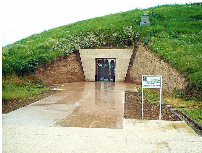
Фиг.7 Свещарската гробница до гр. Исперих

Релефът на България също е подходящ. Имаме си планини с алпийски характер, по-ниски за разходки, равнини, каньони, пещери и природни забележителности и феномени. Не всички държави могат да се похвалят с това. Имаме тракийски гробници и светилища, но те са сътворени от човека. Тук визирам само създадените от природата, които не са никак малко: Белоградчишките скали, Побитите камъни, Чудните скали, многобройните пещери, водопади (не толкова високи, на изключително красиви). "По запазени обекти в културно наследство сме трети в Европа след Италия и Гърция" [7]. Съкровищата от Наг Сент Миклош (намира се в Румъния близо до унгарската граница) е наше от времето на княз Аспарух. Преди се смяташе, че е от Атила, но се вижда написана 6021 година от сътворението на света. При превръщане към сегашното летоброене получаваме 693-точно тогава княз Аспарух е в разцвета на своето могъщество. Българите не са били бедни и са имали много злато и съкровища. На разглежданата територията има три езера- Дуранкулашко, Езерецко и Шабленско, 44 микроязовира и над 250 естествени чешми, подхранвани от карстови води.