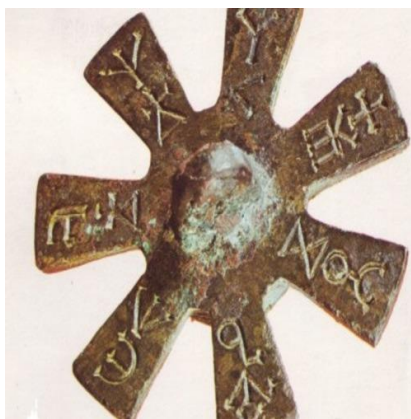
Фиг.2 Седемлъчевата розета, намерена в Плиска

Войната е краткотрайна и завършила с абсолютен успех за българите. Отец Паисий Хилендарски съобщава за две нахлувания на император Юстиниан II Ринотмет в пределите на България през две последователни години, като аналогично са се случили събитията: първоначално византийците печелят, но на връщане на два пъти са разбити. Очевидно става дума за един по-продължителен конфликт, при който успехите отначало се редуват, а окончателната победа е за княз Аспарух. Следващият противник, срещу който се изправяме при княз Аспарух е Аварския хаганат. Той е силна по това време държава, намираща се на северозапад от България. Новата ни държава е принудена да се бие срещу аварите, поради зачестилите гранични конфликти. На два пъти има по-сериозни сражения, които не завършват с пълна българска победа. За тях няма много писано, но доколкото границата на България е оформена и изместена доста на северозапад съдим, че кампаниите през 690 и 693 г. са били успешни за нас. Българите изглежда са постигнали своето- границите на две от трите страни са изгодни и в наша полза очертани. Срещал съм информация за тези две сражения в "Български военен атлас", отбелязани с цвят, с който се означаваха Аспаруховите победи. Отново България успява да защити територията си.