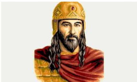
Фиг.3 Княз Тервел (700-721 г.)

скоро приемам, че границата е била р. Днестър, а зоната до р. Днепър е била неутрална територия, слабо населена.