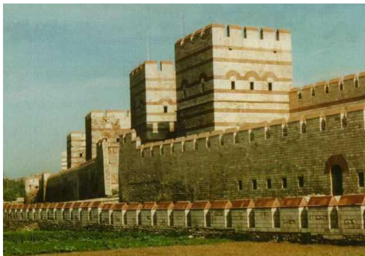
Фиг.4 Крепостната стена на Константинопол

имало друга Велика сила в Европа?), после я победил при смяната на владетеля, очертал е първо далечната от гледна точка на посоката на идване граница с две, макар и несъществени победи над Аварския хаганат и накрая се е справил с врага, от който бяга- Хазарския каганат, отново на два пъти. Князете от Първото Българско царство са били отлични войни. Ползвали са двойнорелексия български лък, наричан още "Картечницата на древния свят" [4], яздили са отлично и са имали военна подготовка на много високо равнище. Затова първата сериозна загуба идва едва през 763 г. при Анхило при управлението на княз Телец, който заплаща с короната и живота си поражението, дължащо се на младостта, поради неопитност и прибързани решения,