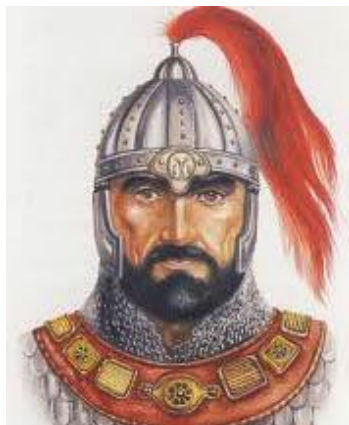
Фиг.1 Княз Аспарух (681-700 г.)

станала нарицателна за подъл, нечестен, лукав човек. Впоследствие византийските хронисти спестяват истината и ни назовават ту власи, ту скити и какви ли не, само да не сме българи. Дори българските владетели ги наричат с несъществуващи за нас титли, като архонт. За първи път името България се споменава на Шестият Вселенски църковен събор в Константинопол на 9 август 681 г. [1] . Тук е първата и най-важна победа на княз Аспарух и тя е постигната над една от най-мощните за времето си държава.