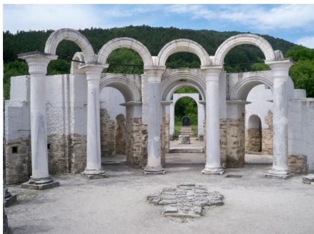
Фиг.9 Крепостта във Велики Преслав

Погледнато от много страни мястото на България е изгодно за развитието. Влияние оказват и други фактори впоследствие, като съседите, военно-политическите групировки, уменията да се разработват и използват природните дадености. През голяма част от историята ни река Дунав е текла през изцяло българска територия. Точно североизточната част на България е била в основата на зараждането и развитието на България. Към днешно време това би ни донесло полза от преминаването на плавателни съдове през българска територия. Река Дунав е била граница, още при Римската империя.