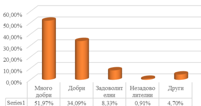
Фиг. 2. Първи впечатления на новоприетите студенти от ШУ

От данните е видно, че общата оценка за първите впечатления на студентите от ШУ е позитивна. На ниво университет 51,97% от респондентите дават много добра оценка, 34,09% - добра и 8,33% - задоволителна. (Фиг. 2) Най-щедри в оценката са анкетираните от ПФ, където 61,18% са за много добра оценка. Най-критични са студентите от ФМИ, където само 35,78% се придържат към тази оценка.