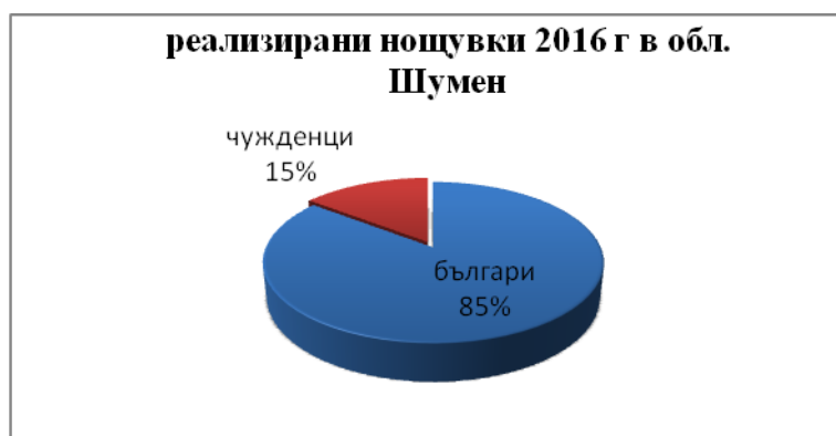
Фиг. 1. Реализирани нощувки по националност в обл. Шумен за 2016 г.

При изчисляване на отношението на посочените два индикатора (брой пренощували лица и реализирани нощувки) можем да определим и средния престой на един турист в областта. Този показател е важен с оглед средствата, които всеки от тях оставя и е показателен за вида практикуван туризъм. За 2016 година това отношение показва среден престой от 1.5 дни средно на един турист. Същият показател се получава и при отношението на данните за 2011 година. Това показва, че профилът на туристите не е променен. Той е устойчив и предвидим. Считаме, че това са предимно бизнес пътувания, краткосрочни и най-вече в общинския център град Шумен. Анализът на данните по народност показват някои различия. За 2016 година средният престой на чужденците туристи в областта е 2.1 дни, което е логично с оглед разстоянията на предприетите пътувания. Считаме, че те отново са чисто делови. Възможно е да са и пътуващи туристи с кратък престой за наблюдение на културно-исторически обекти в региона