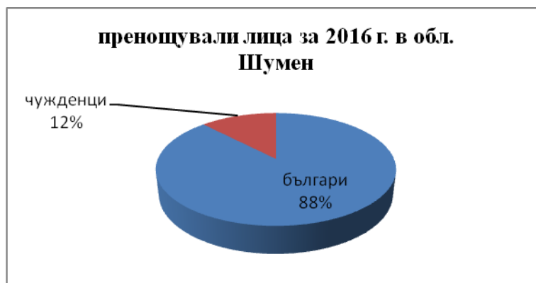
Фиг. 2. Пренощували лица в област Шумен за 2016 г.

Ако се разгледат реализираните нощувки за българи и чужденци (фиг. 1) ясно се вижда, че преобладават българите и то с дял от 85%. Чужденците са твърде малко за туристическа дестинация като територията на област Шумен. Това е региона на старите български столици, с глобалния символ на България и една от най-високите концентрации на културно-исторически обекти в страната. В този контекст са и дяловете на останалите измервани параметри. Пренощувалите лица (българи и чужденци) имат същия относителен дял както и реализираните нощувки (фиг. 2). Приходите от нощувки показват същата тенденция (фиг. 3). Това показва, че общият анализ на натоварването на настанителната база от чужденци в региона е незадоволителен. Чужденците, дори да посещават туристическите обекти, не пренощуват тук или ако го правят техният престой е твърде кратък. Необходимо е да се работи в тази насока. Припомняме че над 1 млн. румънски туристи почиват ежегодно по Северното черноморско крайбрежие на България. Техният път преминава през територията на областта.