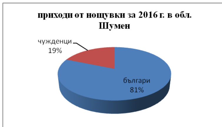
Фиг. 3. Приходи от нощувки в област Шумен за 2016 г.

Сравнителният анализ спрямо 2011 година показва, че има известно намаление на броят на реализираните нощувки от чужденци, пренощували в обектите за туризма в областта. През 2011 г. той е бил малко над 15 хил. нощувки, а през 2016 г. – около 13 хил. Спада с над 2 хил. е обезпокоителен и е с близо 15%. На фона на нарастващите общ брой туристи и приходите от тях е очевидно, че този ръст се дължи на българските туристи.