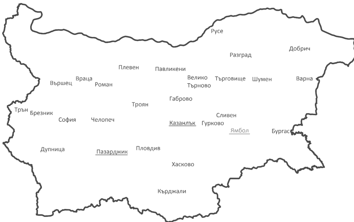
Фиг. 3. Селищата, участвали с отбор на Български географски фестивал