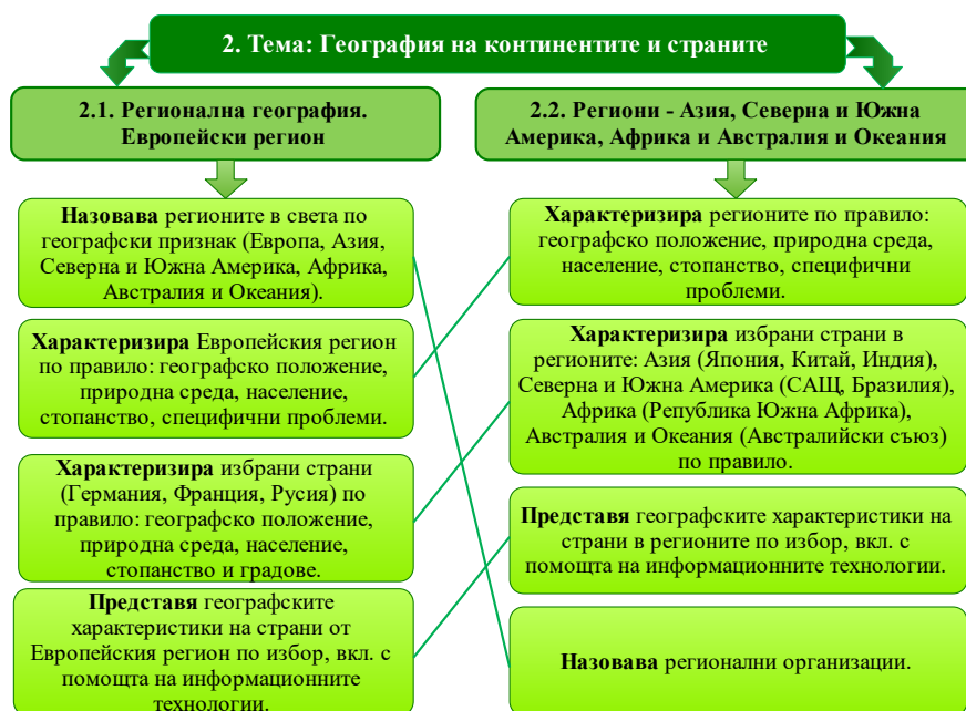
Фиг. 2. Съпоставителен модел на компетентностите като очаквани резултати от обучението по подтеми

Активните глаголи представящи компетентностите като очаквани резултати от обучението по теми са общо три: характеризира (с честота на повтаряемост 4 пъти), назовава (2 пъти) и представя (2 пъти). Реално прилагането на активния глагол характеризира е приложен два пъти по аналогия за характеризирание по правило на регион и два пъти при характеризирание по правило на избрани страни. Характеризирането на регион и страна по правило е насочено към когнитивната приложимост на знанията, уменията и отношенията. Активният глагол назовава , като репродуктивна конкретизация (познаване) изисква назоваването на региони в света по географски признак, както и на регионалните организации. Активният глагол представя е консолидиран по отношение и на двете подтеми към използването на информационните технологии при представянето на географските характеристики на страни в регионите. Съпоставени по двете подтеми компетентностите като очаквани резултати от обучението, въведени чрез активните глаголи по таксономията на Б. Блум се припокриват (фиг. 2). [1, 6]