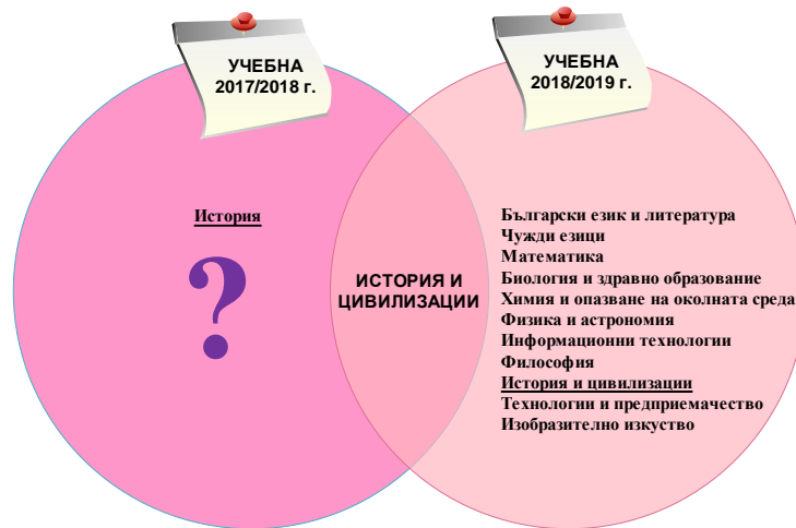
Фиг. 5. Вен-диаграма на хоризонталните връзки между учебни програми по география и икономика в IX клас [5, 6]

междупредметни връзки с 11 учебни предмети с ясно дефинирани връзки чрез активни глаголи и конкретни примери. Новите реалности разгръщат приложимостта и ефективността на хоризонталните връзки при постигане на очакваните резултати по ключовите компетентности (фиг. 5). Вен-диаграмата разкрива само една обща хоризонтална връзка между двете учебни програми – история и цивилизации. [1, 5, 6]