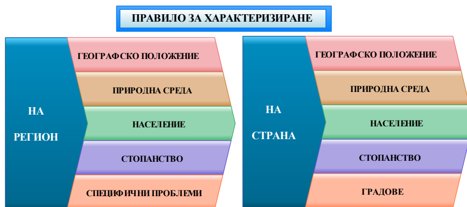
Фиг. 1. Правило за характеризирание на регион и страна по учебна програма (в сила от учебната 2018/2019 год.)

характеризиране на градовете, в контекста на традиционните географски алгоритми. Новата реалност въвежда понятието правило за характеризирание на регион и страна, заменяйки понятието алгоритъм . Общо са предложени 10 страни за изучаване: Европа – Германия, Франция и Русия; Азия – Япония, Китай, Индия; Северна и Южна Америка – САЩ и Бразилия; Африка – Република Южна Африка; Австралия и Океания – Австралийски съюз. [6]